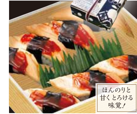
ほんのりと 甘くとろける 味覚!

おすし盛合せ(折詰) ¥1,500 [税込] まぐろ・テリイカ・エビ・あなご・カッパ巻・鉄火巻・ 玉子焼にぎり ※一折・二人折もごさいます。