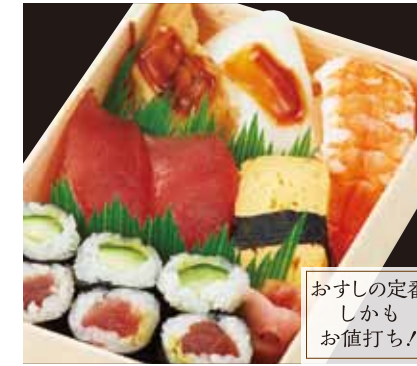
おすしの定番 しかも お値打ち!

東鮓一番(折詰) …… ¥2,070 [税込] 中トロ・サーモン・まぐろ・煮あなご・生エビ・ 鰻松前にぎり・鉄火巻・玉子焼にぎり