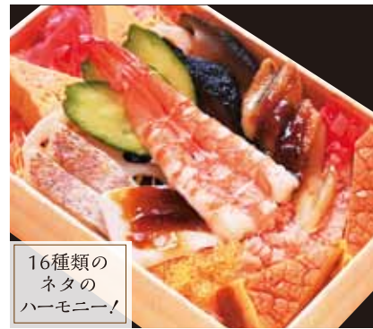
16種類の ネタの ハーモニー!

江戸前ちらし(折詰) ¥2,170 [税込] まぐろ・エビ・白身・あなご・イカ・玉子焼・胡瓜・椎茸・ とびこなど