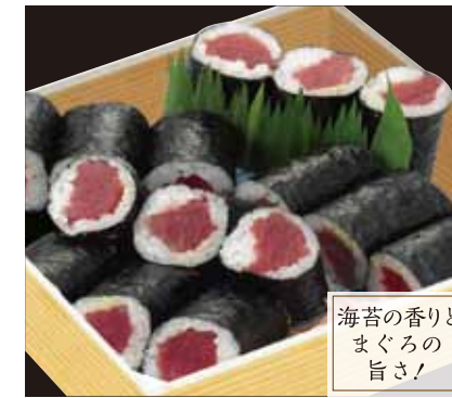
海苔の香りと まぐろの 旨さ!

京ちらし …… ¥1,070 [税込] あなご・小鯛・椎茸・干瓢・酢蓮根・おぼろ・とびこ・ 胡瓜など