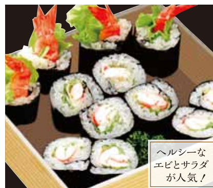
ヘルシーな エビとサラダ が人気!