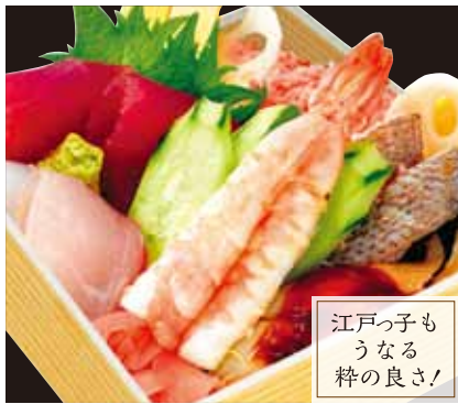
江戸っ子も うなる 粋の良さ!

江戸前ちらし(折詰) ¥2,170 [税込] まぐろ・エビ・白身・あなご・イカ・玉子焼・胡瓜・椎茸・ とびこなど