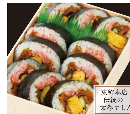
東鮓本店 伝統の 太巻すし!

上巻すし(折詰) …… ¥1,500 [税込] (文庫) …… ¥1,420 [税込]