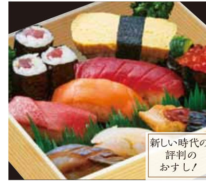
新しい時代の 評判の おすし!

特撰すし(折詰) …… ¥2,220 [税込] イクラ・まぐろ・白身・あなご・エビ・鉄火巻・ 玉子焼