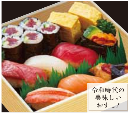
令和時代の 美味しい おすし!

東晴れあつぱれ(折詰) ¥3,420 [税込] 中トロ・サーモン・まぐろ・上煮あなご・本ズワイガニ・ 白身・ウニ・鉄火胡瓜・玉子焼