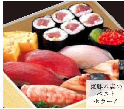
東鮓本店の ベスト セラー!

東晴れあつぱれ(折詰) ¥3,420 [税込] 中トロ・サーモン・まぐろ・上煮あなご・本ズワイガニ・ 白身・ウニ・鉄火胡瓜・玉子焼