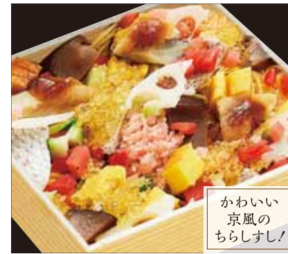
かわいい 京風の ちらしすし!

ちらしすし(折詰) …… ¥1,500 [税込] エビ・あなご・玉子焼・蓮根・椎茸・胡瓜・とびこ・ テリイカ・おぼろなど