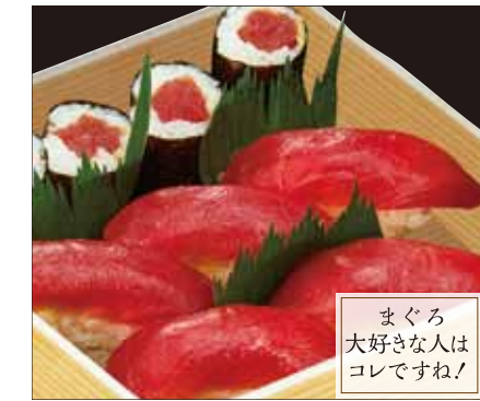
まぐろ 大好きな人は コレですね!

鉄火巻(折詰) …… ¥1,620 [税込] (一折詰) …… ¥2,250 [税込]