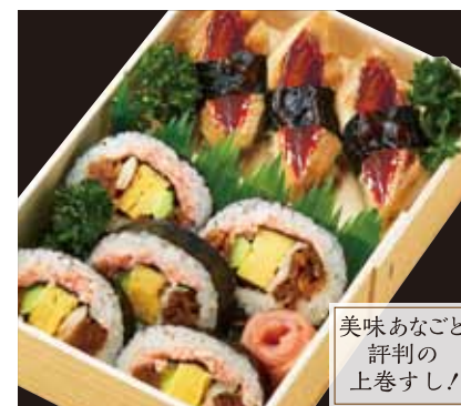
美味あなごと 評判の 上巻すし!