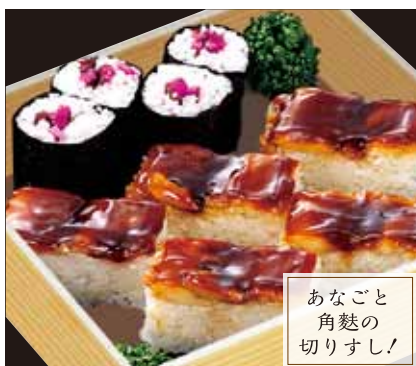
あなごと 角麩の 切りすし!