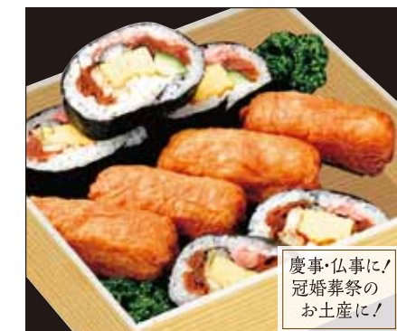
慶事・仏事に! 冠婚葬祭の お土産に!

上巻すし(折詰) …… ¥1,500 [税込] (文庫) …… ¥1,420 [税込]